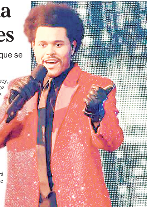
THE WEEKND abrirá la agenda de conciertos con su presentación el próximo miércoles en el estadio El Campín de Bogotá. / Britannica

En 2023 llegará una de las giras más ambiciosas y esperadas en nuestro país. Saturno World Tour 2023 ya confirmó sus fechas y ahora ya tenemos los grandes escenarios donde Rauw Alejandro pondrá a bailar a todos sus fans