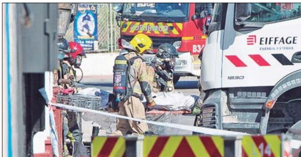
HASTA ANOCHÉ habían sido confirmadas 13 víctimas mortales por el incendio en la discoteca Teatre del barrio Atalayas, en la española ciudad de Murcia.

Aún se desconoce el origen del incendio y las circunstancias en