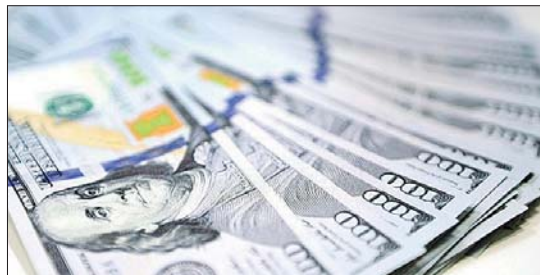
LAS TRANSFERENCIAS corrientes, el componente superavitario de la cuenta corriente, se ubicaron en 3.5% del PIB correspondientes a US$3.018 millones.

Este resultado representa una disminución de 1.2% respecto al déficit del primer trimestre de 2023 (-4.2% del PIB, equivalente a -US$2.524 millones) y de 2.5% frente al -5.5% del PIB registrado en el segundo trimestre de 2022 (-US$4.951 millones). Con