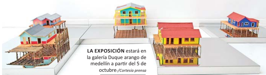
LA EXPOSICIÓN estará en la galería Duque arango de medellín a partir del 5 de octubre.

En el año 1996, García se desplazó a Bogotá para ingresar a la Universidad Nacional de Colombia al programa de Bellas Artes, con el fin de dejar memoria, a través del arte, de la barbarie que padeció la zona en la que creció. Allí, sus preguntas se transformaron en apuestas plásticas que encontraron en el petróleo, madera, acero y óleo su medio de expresión. García ha logrado hacer