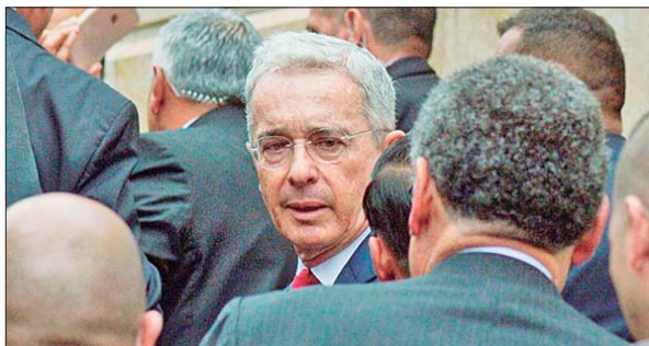
ÁLVARO URIBE, expresidente de Colombia.

informar que, mediante auto del 29 de septiembre de los cursantes, el Despacho dispuso: señalar audiencia virtual para el día 6 de octubre del año en curso a las 02:00 p.m.