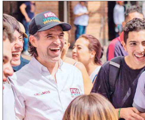
EL CANDIDATO Federico Gutiérrez visitó ayer varias zonas de la capital antioqueña.