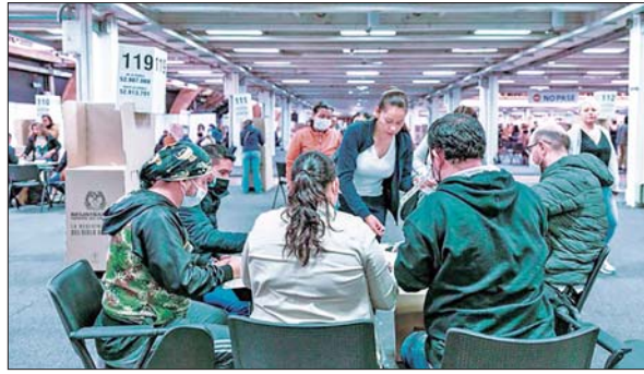
LA MAYORÍA de gobernadores que serán elegidos en los comicios de este mes son respaldados por coaliciones de partidos.