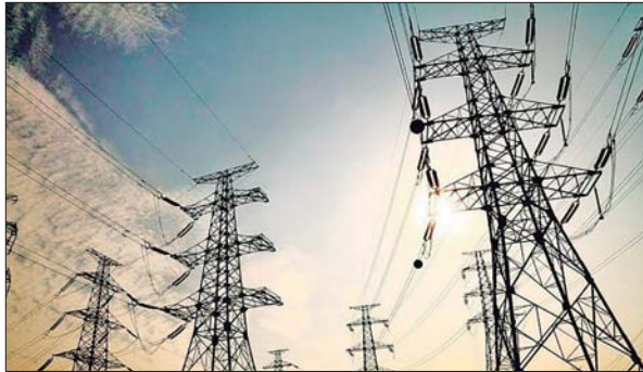
PREOCUPACIÓN POR incremento de tarifas en costa Caribe.

Otro en hacerse eco de esta situación y cuestionar el alto monto de las tarifas de energía en la costa Caribe, como consecuencia de El Niño, fue el alcalde de Barranqui-