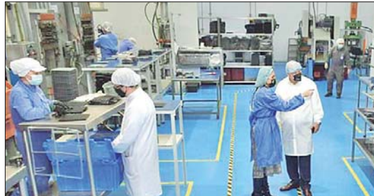
EL SECTOR de las manufacturas está sacando la cara por la industria este año.

De acuerdo con el informe, durante agosto el 17% de la ocupación del país se originó en el sector de comercio y reparación de vehículos; le siguió el agropecuario, con 14,3% del total; la industria manufacturera, que generó el 10,6% de la ocupación, mientras que el 7,3%