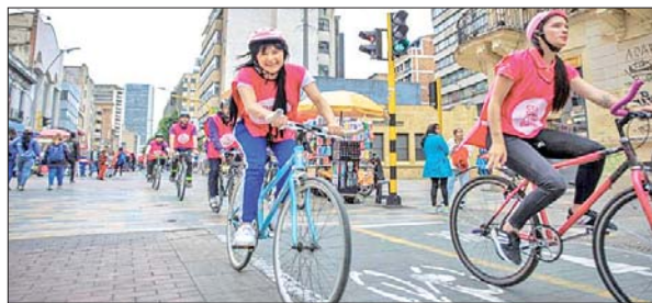
HASTA EL 8 de octubre se estarán realizando más de 45 eventos en toda la ciudad.

De esta forma, con los más de 45 eventos de la Semana de la Cultura Ciudadana, organizada por la Secretaría de Cultura, Recreación y Deporte, la idea es incitar discusiones sobre la cooperación y el cuidado en Bogotá para establecer los acuerdos necesarios entre los diversos actores que la habitan y