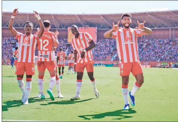
EL COLOMBIANO (9) se jugó un partido histórico, con un triplete en apenas cinco minutos, pero luego salió lesionado de gravedad.

En partido clave para el descenso en la liga española, el samario marcó tres goles en cinco minutos y luego se fracturó el peroné